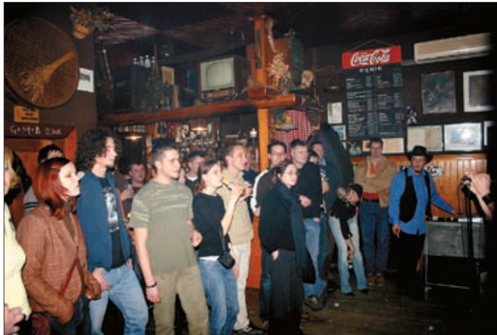
Lovrenc je rokarski kraj.