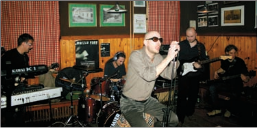
Marzla vada - kult lovrenškega rokenrola